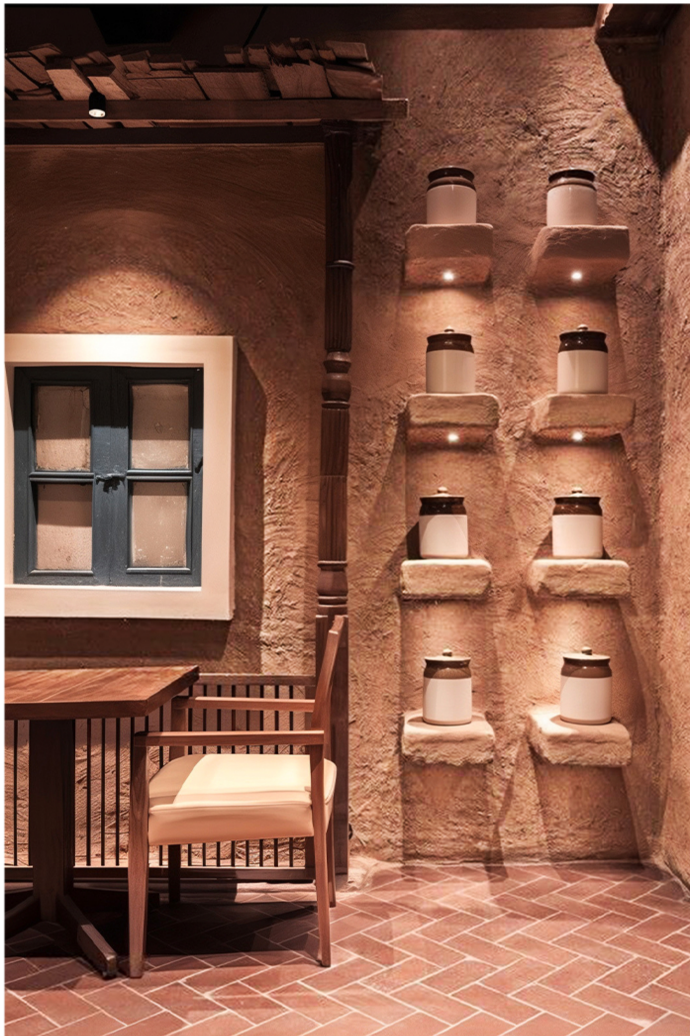
CONPA - CONCRETE EFFECT / Conpa.vn || 0989000899